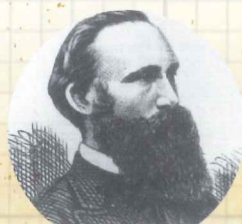
英國長老教會首任駐台牧師