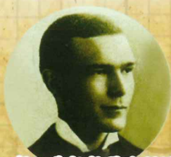
彰化基督教醫院創辦人