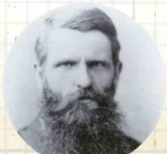
台灣盲人照護先驅