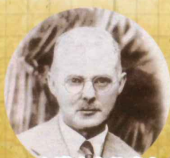
台灣痲瘋救濟之父